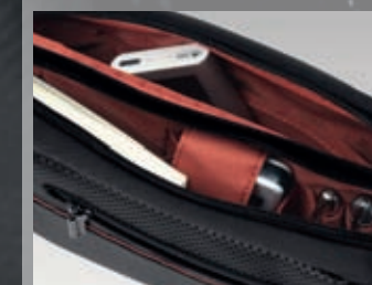
UPTREND Le sac urbain organisé The organized street bag