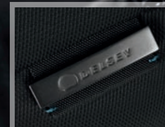
QUARKS Souplesse et ingéniosité Flexible and ingenious